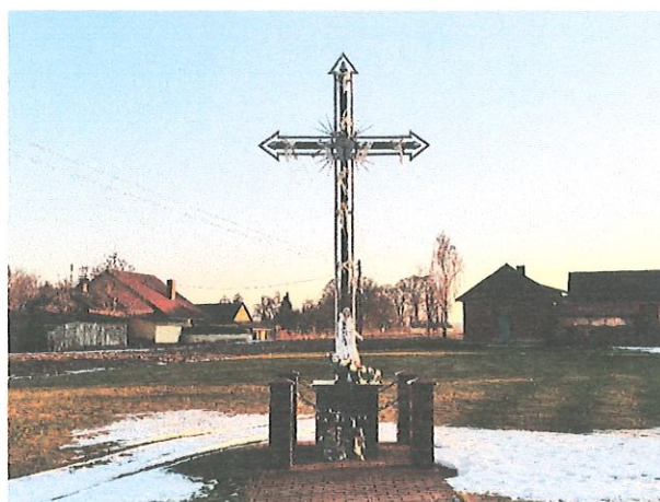
Krzyż przydrożny w centrum