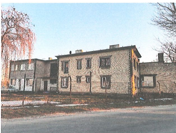
Budynek po dawnej szkole