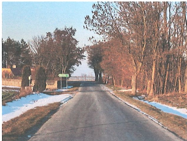
Infrastruktura drogowa sołectwa