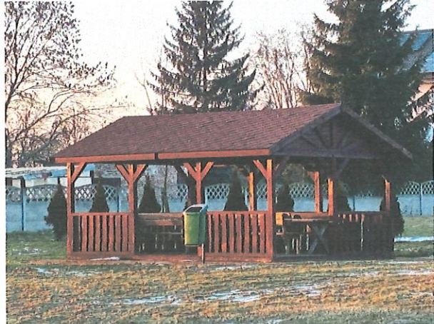
Altana na placu rekreacyjnym