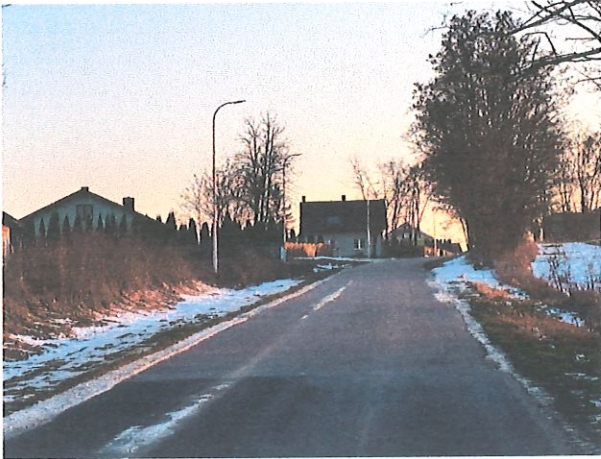
Infrastruktura drogowa sołectwa